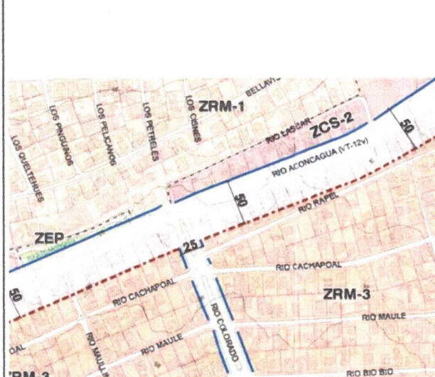
(m) Zona ZRM-3 – Zona Residencial Mixta 3

Detalles del receptor: al igual que la fuente emisora, según la planimetría del plan regulador comunal se encuentra en zona residencial mixta 3.